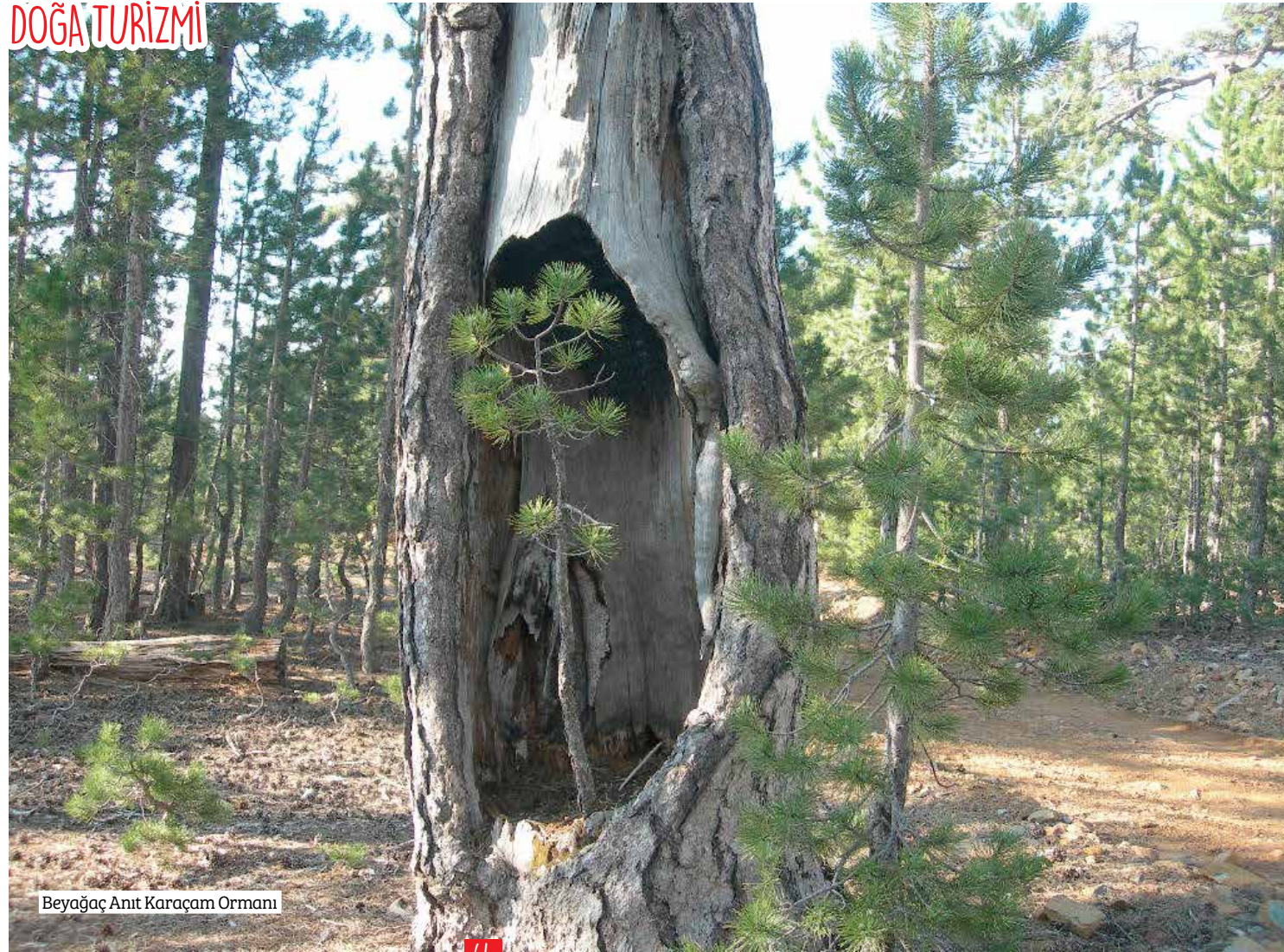
Bey ağaç Anıt Karaçam Ormanı