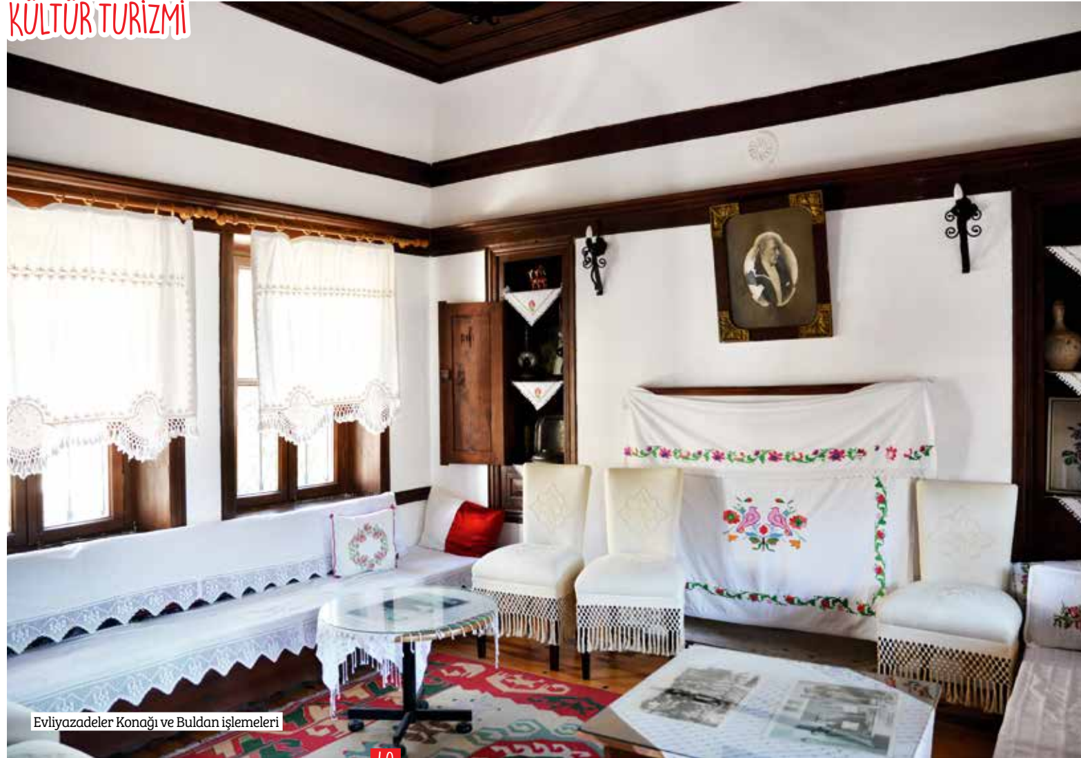
Evliyazadeler Konağı ve Buldan işlemleri