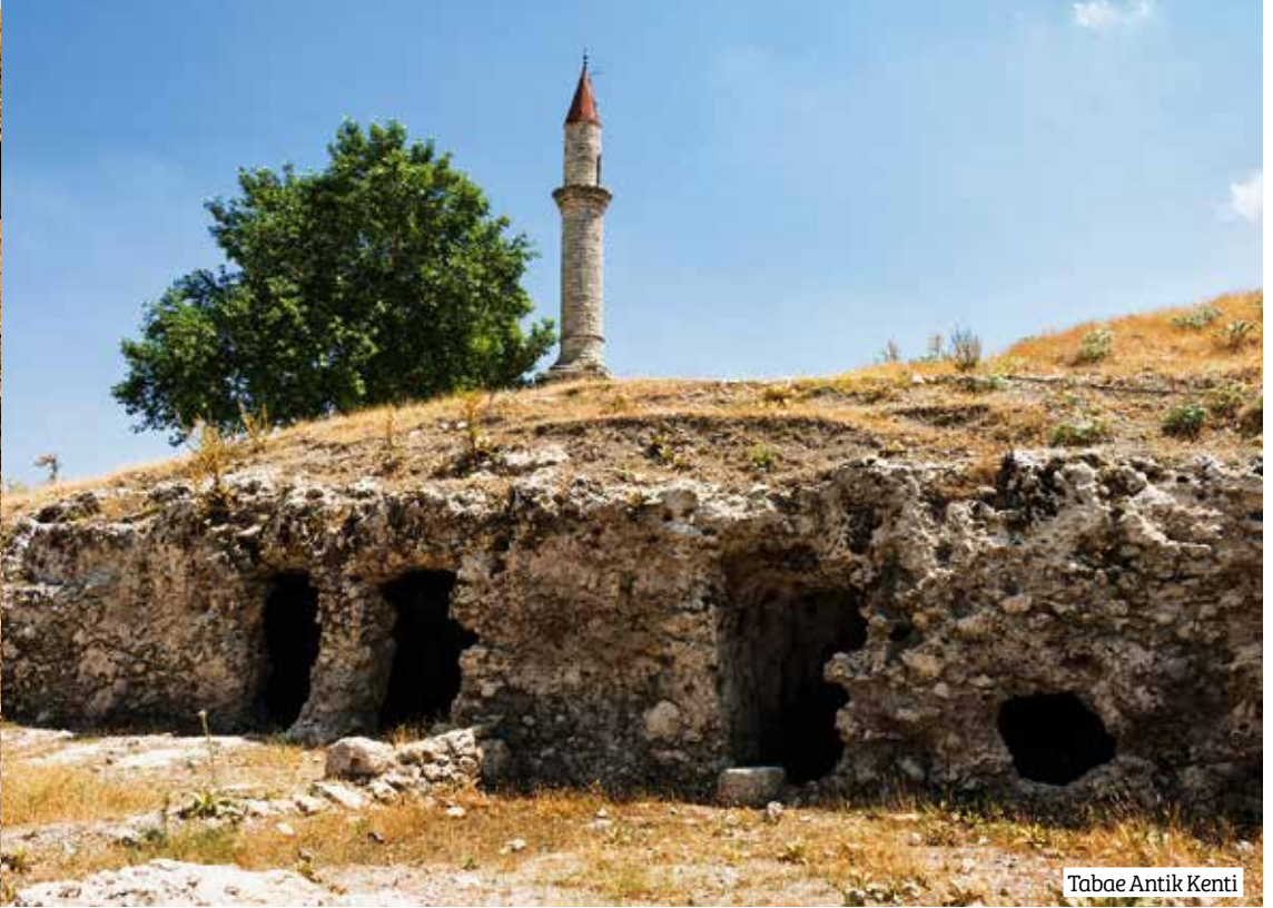
Tabae Antik Kenti