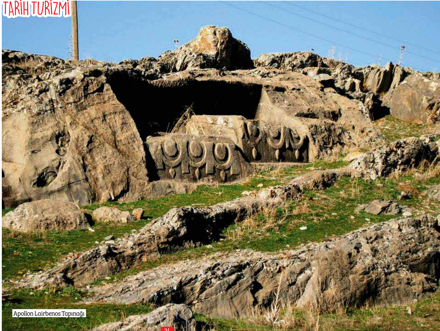
Apollon Lairbenos Tapınağı