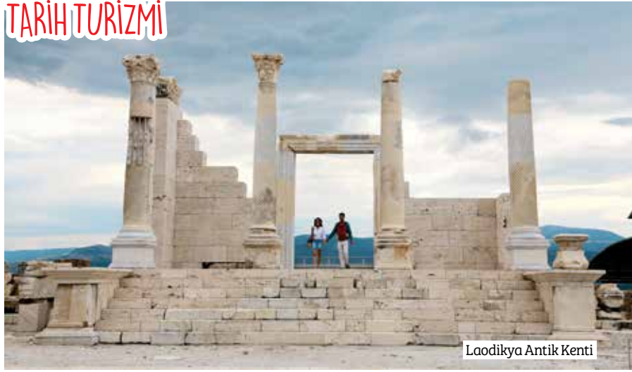
Laodikya Antik Kenti