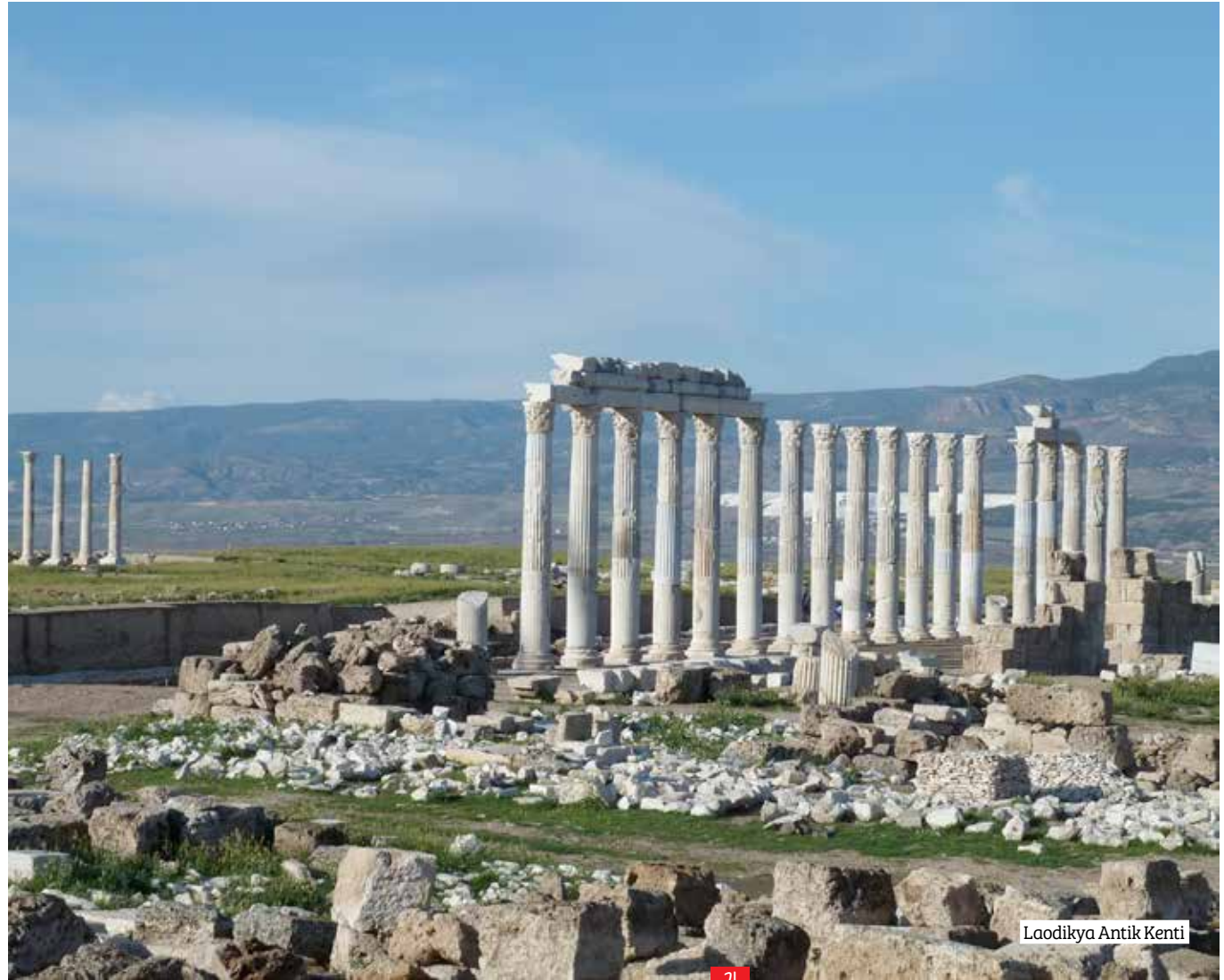
Laodikya Antik Kenti

Denizli-Pamukkale yolu üzerindeki antik kent, şehir merkezine 6 kilometre uzaklıkta. Tarihi M.Ö. 3000 yılına kadar uzanıyor. Yapılan kazılarda Geç Kalkolitik Eski Tunç Çağı'na kadar inen mimari, seramik ve çakmaktaşı buluntularına ulaşılmış. İncil'de yer alan Küçük Asya'nın yedi ünlü kilisesinden birinin burada yer alması ve Erken Bizans Dönemi'nde kentin metropolitlik seviyesinde dini bir merkez haline gelmesi, Hıristiyanlığın kentte ne kadar güçlü olduğunun bir göstergesi. Bu yönüyle, günümüzde önemli bir inanç turizmi merkezi. Laodikya aynı zamanda bir ticaret merkeziymiş. Yaklaşık 5 kilometrekarelik alana yayılan Laodikya'nın günümüze kadar gelebilen önemli yapıları arasında, Anadolu'nun en büyük stadyumu, iki tiyatrosu, dörder hamam kompleksi ve agorası, beş anıtsal çeşmesi, iki anıtsal giriş kapısı, meclis binası, tapınakları, kiliseleri ve anıtsal caddeleri sayılabilir.