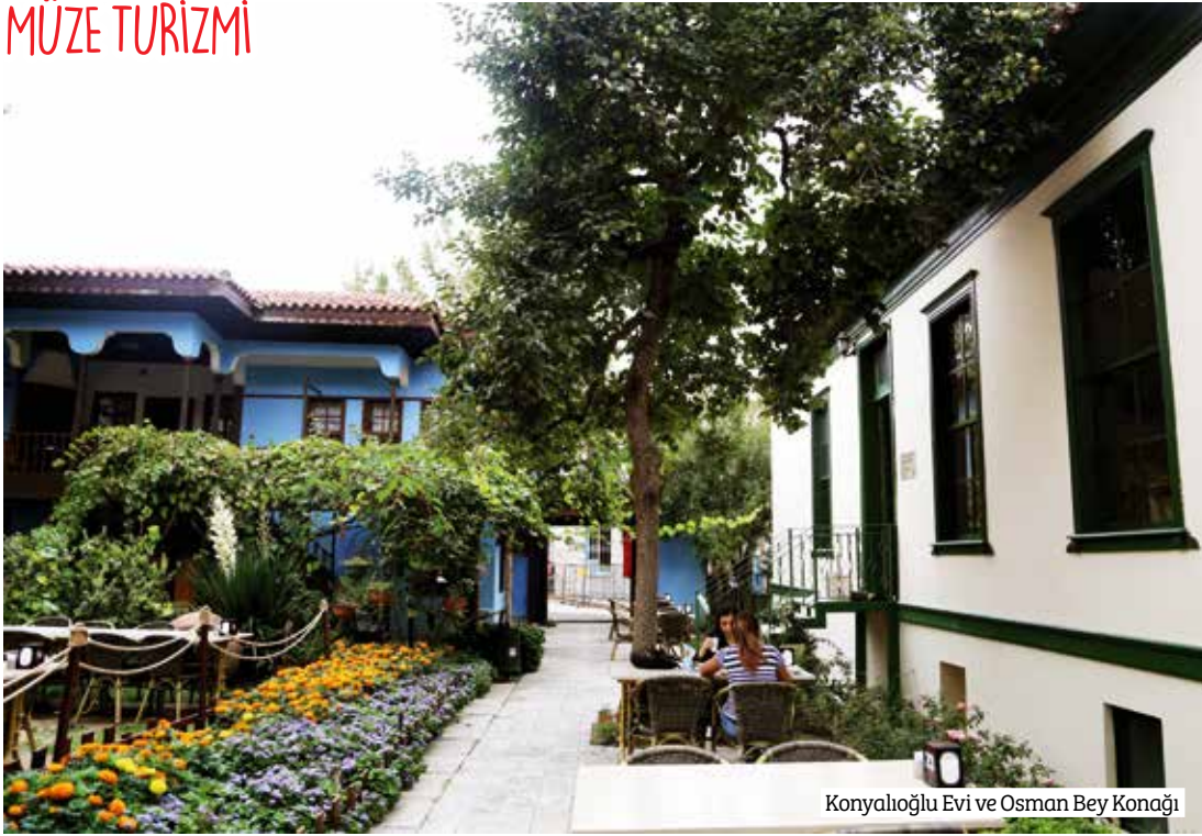
Konyalıoğlu Evi ve Osman Bey Konağı