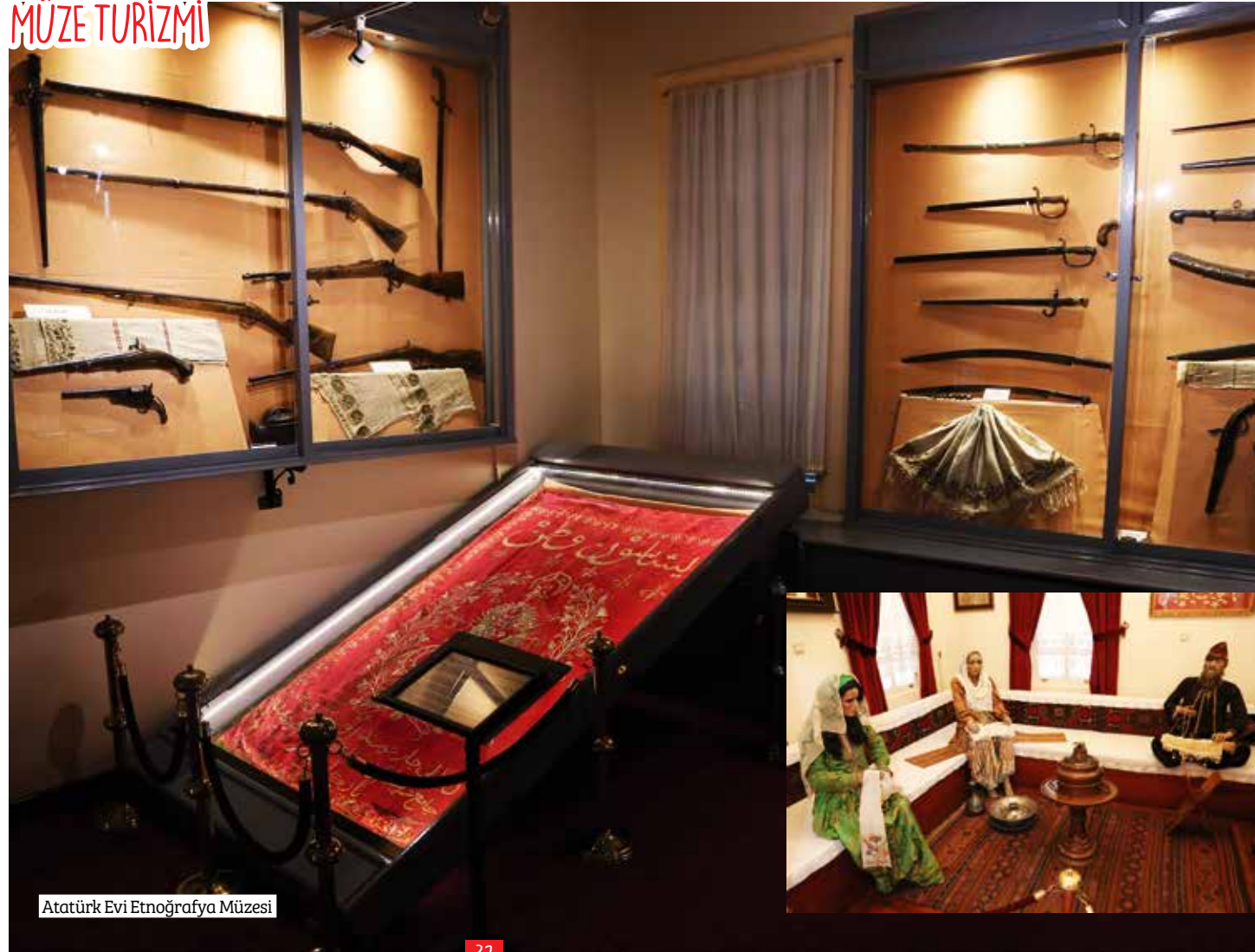
Atatürk Evi Etnoğrafya Müzesi