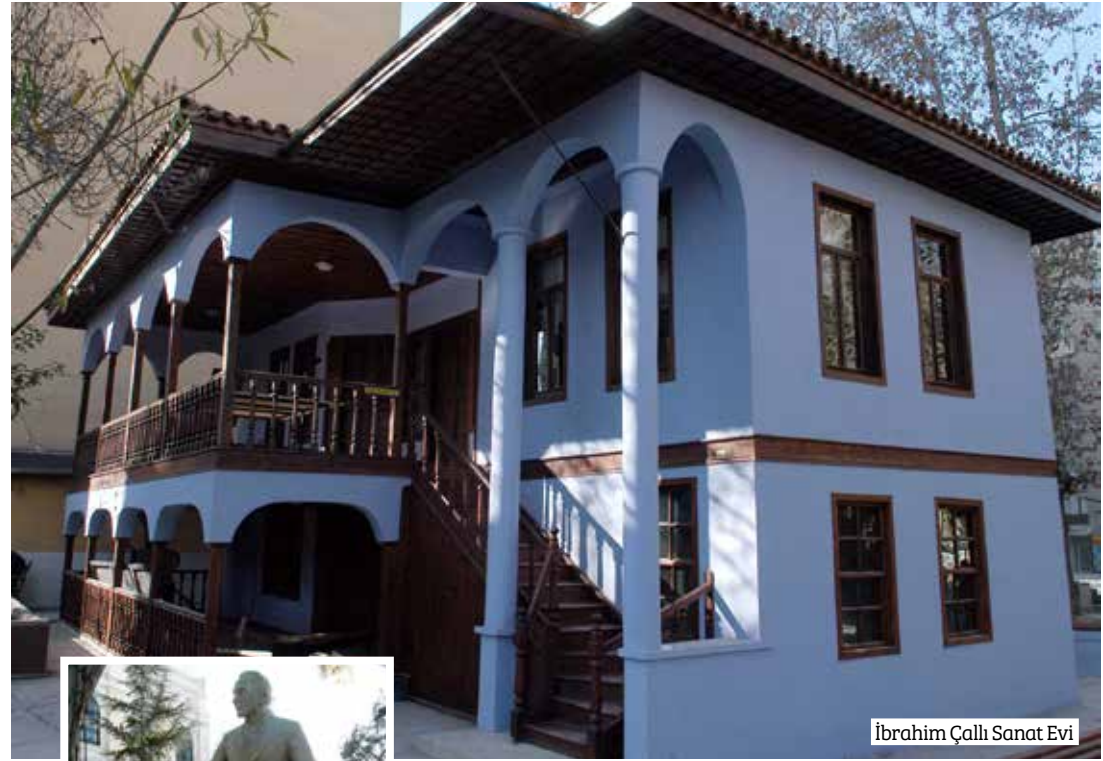
İbrahim Çallı Sanat Evi

Denizli'ye ve Osmanlı mutfağına özgü tatları bulabileceğiniz Denizli Konağı, bahçe içinde bir tarafı restoran, diğer tarafı kafeterya olarak kullanılan Osman Bey Konağı ve Konyalıoğlu Konağı'ndan oluşuyor. Burada yöresel ürünlerin satışının yapıldığı bir butik mağaza da mevcut.