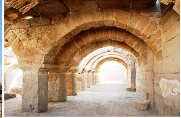
Tripolis Antik Kenti