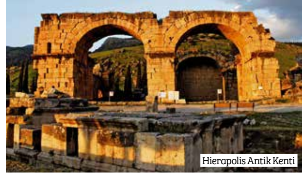
Hierapolis Antik Kenti