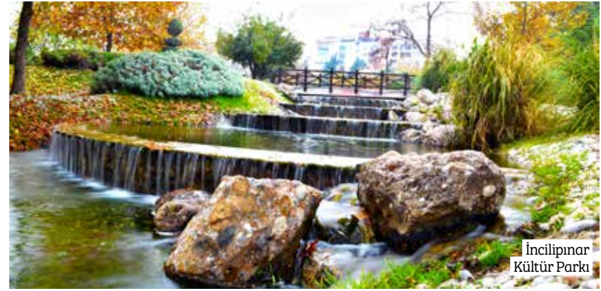
İncilipınar Kültür Parkı