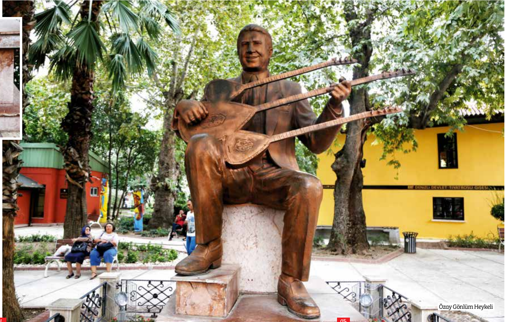
Özyay Gönülüm Heykeli

Kendine has üçlü sazı 'yaren' ve mizah anlayışıyla Denizli başta olmak üzere Ege'nin gönlünde taht kuran Özyay Gönülüm, şehrin en önemli halk sanatçılarından. 2000 yılında vefat eden sanatçının heykeli, şehrin merkezine yerleştirilmiş. Sanat hayatı boyunca 30 civarında 33'lük/45'lik ve 30 kadar kaset çıkararak, 200 türkünün derleyicisi olan Gönülüm'ün en bilinen eserleri arasında 'Elif Dedim Be Dedim', 'Evlerinin Önü Bulgur Kazanı', 'Arabaya Taş Koydum' yer alıyor.